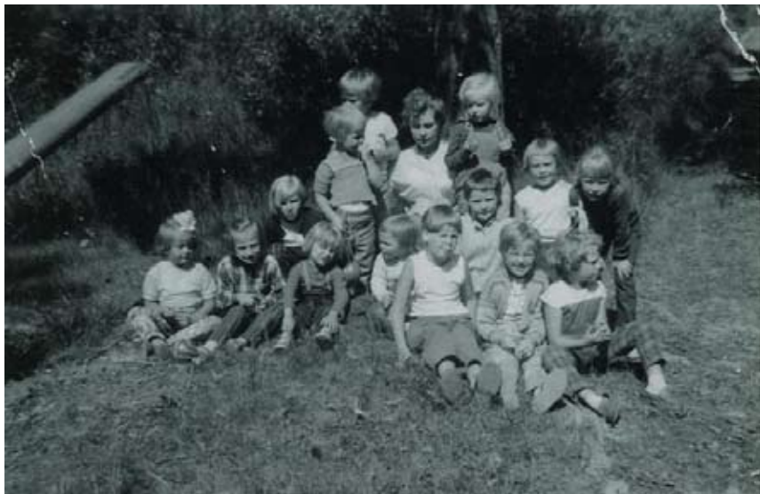
Jentegruppe på Skogly. Bilde fra 1959.