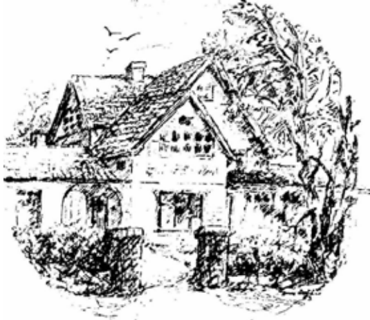
Cafe Rasten, vårt første "rådhus".