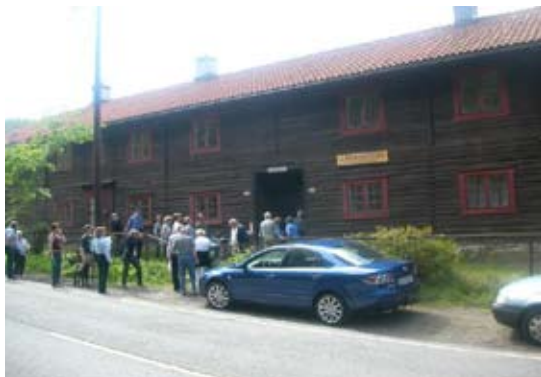
Langbygningen slik den nå fortoner seg sett fra Gamle Mossevei – eller Ljansbruveien – som den nå heter innefor Oslos grense.