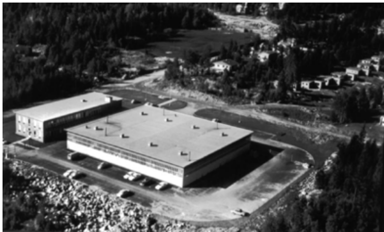
Fords nybygg (1962) som nå huser DFDS. Sofiemyr "stadion" i bakgrunnen

I den siste tiden er det kommet et utall av firmaer til kommunen vår, noen er døgnfluer, men mange består. Handelslekkasjen i kommunen er stor og i disse dager (2004) starter arbeidet med utbyggingen av Kolbotn Vest. Når Kulturhuset er ferdig starter rivingen av Samfunnshuset og ombygging av Solgården for å gi plass til et stort kjøpesenter og en god del boliger.