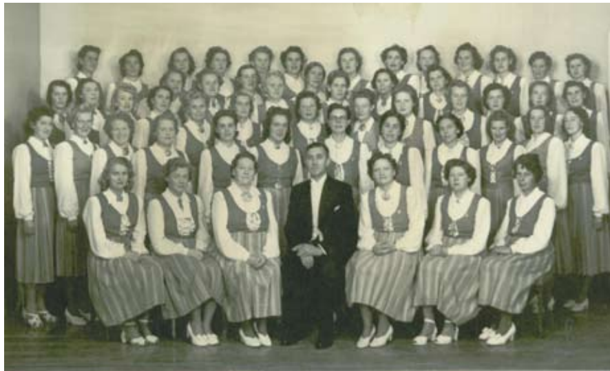
Kolbotn damekor. Stiftet i 1924.

I 1921 får vi den første speidertroppen på Kolbotn og etter hvert også på Oppegård og Myrvoll. Etter krigen blir det også egen tropp på Solbråtan. Først i 1927 kommer pikene med. Etter 1978 er gutte- og pikespeiding slått sammen.