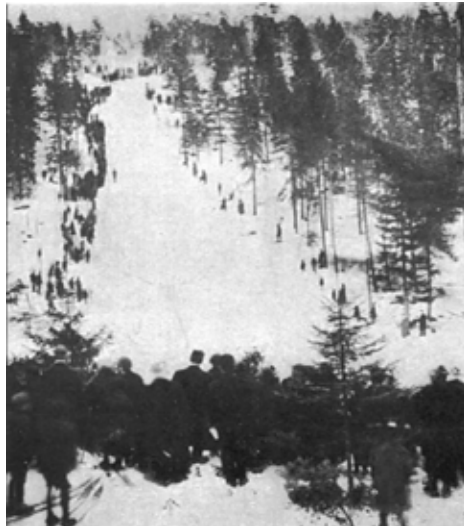
Nybakken i 1920, lå i det vi nå kaller Skrenten.

Til å begynne med hadde man ikke idrettsplasser, så en måtte benytte tilfeldige ”løkker”, landeveien, is på vannene eller skogen. Det blir bygget flere hoppbakker og det er nok vinteridrettene som er mest fremtredende den første tiden. På 1920-tallet blir det idrettsplass ved nåværende Dalens gartneri og først i 1938 blir det åpnet en koksgrusbane på Sofiemyr som de siste årene har blitt til Sofiemyr Idrettspark med tilhørende idrettshall, klubbhus mm. I Oppegård syd kommer det idrettsanlegg på Østre Greverud sammen med en 18-hulls golfbane.