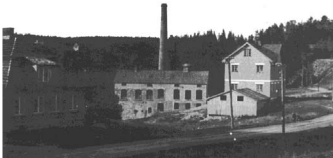
Fra h.Oppegaard trævarefabrik, Union Farveri og Silkeveveri A/S og Greverud skole. Ca 1920

Landhandlerier dukket opp i alle tettstedene, den første på Sætrøhøiden i 1881. Etter hvert kom det også spesialforretninger. Bakerier og andre håndverksbedrifter var det mange av. Fra slutten av 1960-tallet begynner handlesentrene å komme med sine selvbetjeningsbutikker. Den lokale kjøpmann må legge ned.