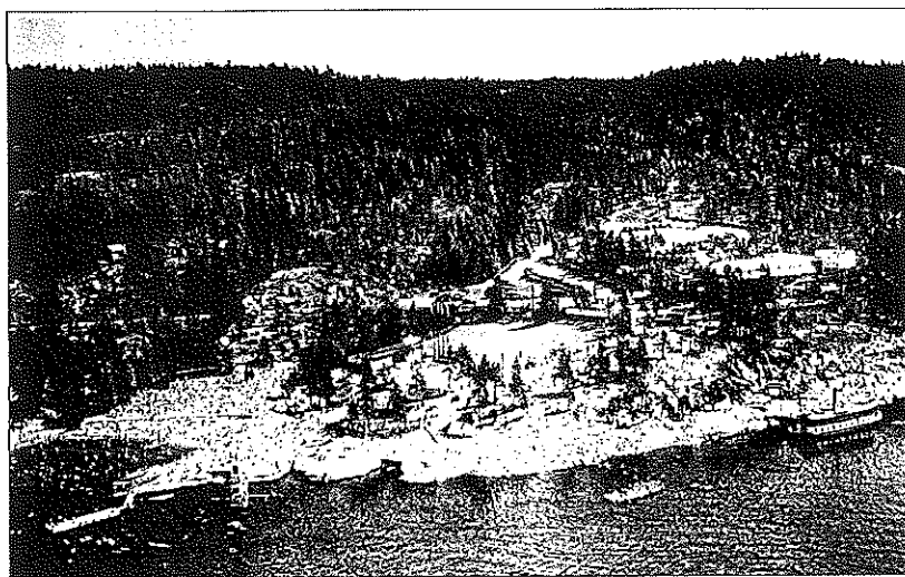
Ingierstrand en varm sommerdag 1949 - yrende badeliv.

Det er Oslo kommune som eier anlegget. Kommunen kjøpte det i 1936 som en gave til bybefolkningen, og for å ivareta friluftssonene rundt hovedstaden.