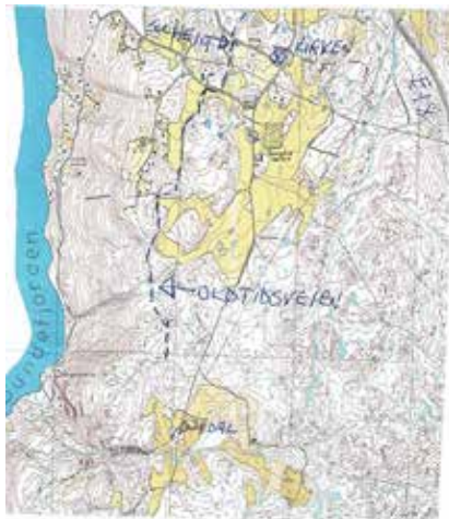
Kart over veitraseen

Den turen som er beskrevet her, egner seg utmerket som en kort vandretur i kulturhistorisk terreng. God tur !