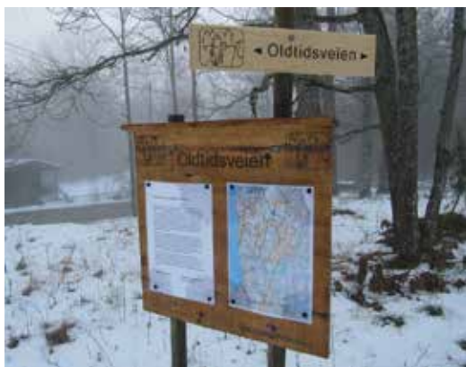
Info-tavla om Oldtidsveien