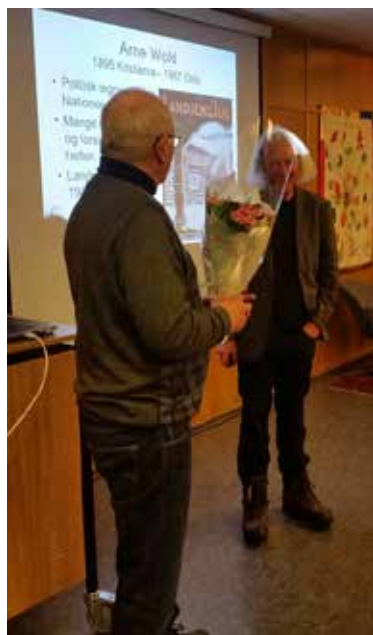
Leder takker for foredraget