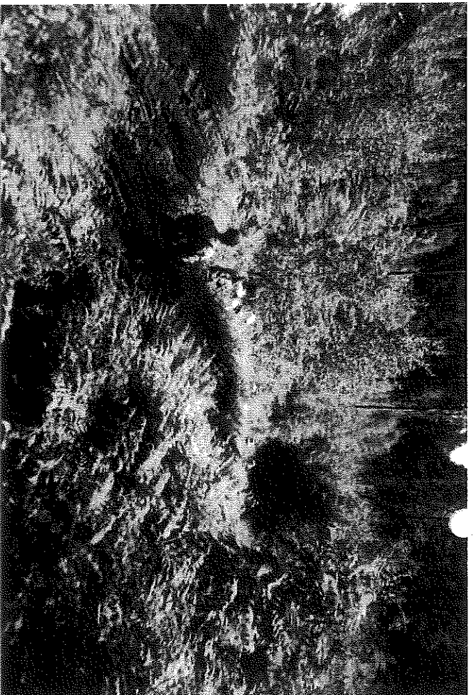
Fixerbilde- hvor er deltagerne? Det trengs å rydde litt!